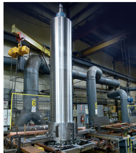
Bassin au chrome